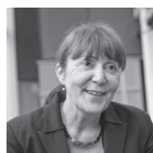
Excma. Sra. Dña. Monica Luisa Macovei

Presidente del Comité de las Regiones de Europa. Finlandia.