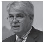
Excmo. Sr. D. Alfonso María Dastis Quecedo

Miembro del Parlamento Europeo. Ex Presidenta de la Comisión de Educación y Cultura del Parlamento Europeo. Italia.