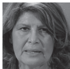
Excma. Sra. Dña. Silvia Costa

Ex directora Científica de la Oficina de Roma de la Conferencia Permanente de Rectores de Universidades Italianas (CRUI) Premio Europeo Carlos V 2016. Italia.