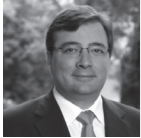
Excmo. Sr. D. Guillermo Fernández Vara

Presidente de la Junta de Extremadura y presidente de la Fundación Academia Europea de Yuste. Presidente del jurado del Premio Europeo Carlos V. España.