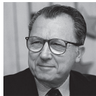
Excmo. Sr. D. Jacques Delors

Ministro de Asuntos Exteriores y Cooperación del Gobierno de España. Vicepresidente del patronato de la Fundación Academia Europea de Yuste.