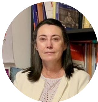
Directora de las jornadas

Catedrática de Derecho del Trabajo y Seguridad Social de la Universidad de Sevilla. Especialista en coordinación de sistemas de Seguridad Social en la Unión Europea. Investigadora principal en España de los proyectos de la Comisión Europea TRESS y SPECIAL