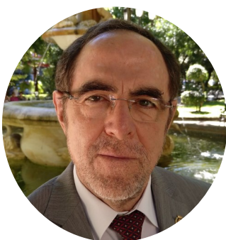
Director de las jornadas