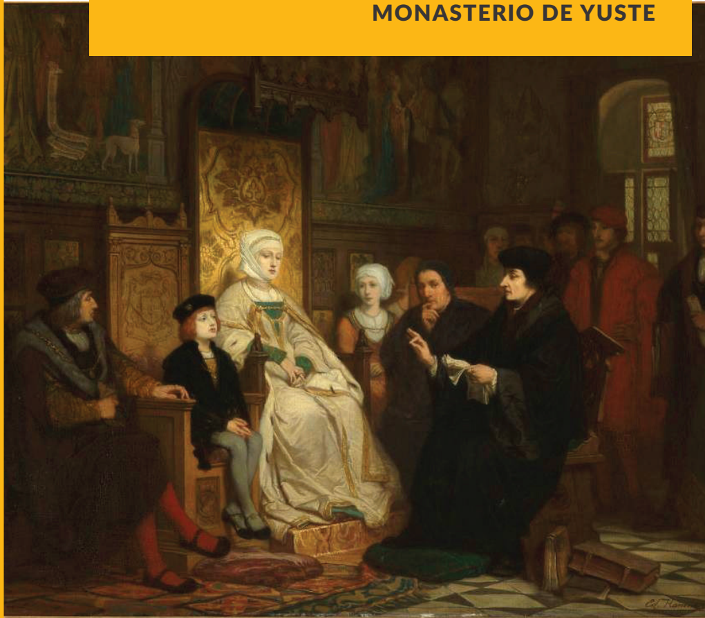
ERASMO DA UNA CLASE A CARLOS V NIÑO, POR E-J. HAMMAN OLEO SOBRE LIENZO - MUSEO DE ORSAY