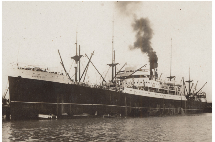
Barco Winnipeg, 1939.