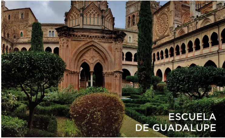
ESCUELA DE GUADALUPE