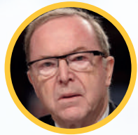
1998 Wilfried Martens