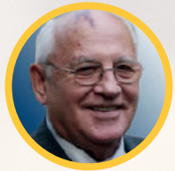
2002 Mijaíl Gorbachov