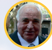
2006 Helmut Kohl