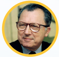
1995 Jacques Delors