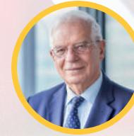
2025 Josep Borrell Fontelles