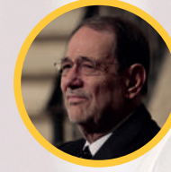
2011 Javier Solana