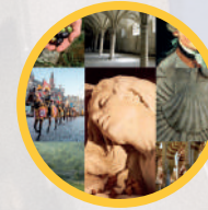
2019 Itinerarios Culturales del Consejo de Europa