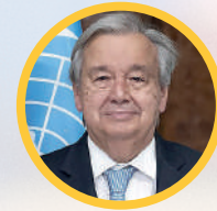
2023 António Guterres