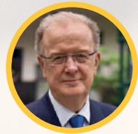
2004 Jorge Sampaio