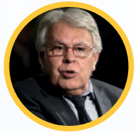
2000 Felipe González Márquez