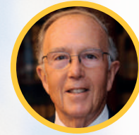
2017 Marcelino Oreja Aguirre