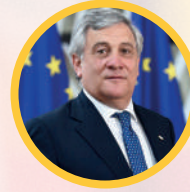
2018 Antonio Tajani